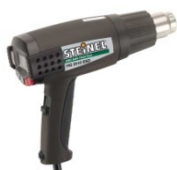
Hete luchtpistool Föhn ( 220V – 1600W )

1e): Elektrische (de-) montage hulp middelen