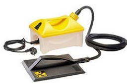
behang stomer A ( 220V-2000 W )