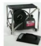
behang stomer B ( 220V-2900 W )