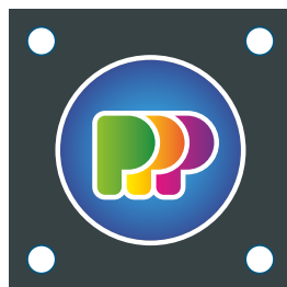
Boorgaten zijn uitgespaard