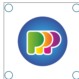
Boorgaten staan te dicht op de rand