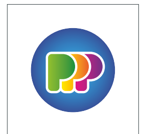
Ontwerp bevat geen boorgaten